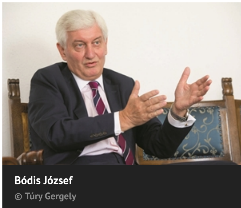
Bódis József

Bódis József, Pécsi Tudományegyetem, a Rektori Konferencia elnöke: